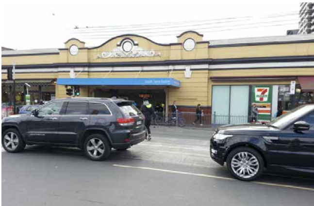
South Yarra Station

Het lotgenotencontact was zoals we dat in Nederland ook kennen, al was het niet in doelgroepen zoals wij gewend zijn. Wat opviel was dat de term DSD voor hen behoorlijk beladen is, zij hebben het dan ook over intersekse aandoeningen. DSD is een medisch ding en dat leidt bij voorbaat tot argwaan. Mijn indruk is dat in grote delen van Australië het taboe mogelijk groter is dan hier maar de vereniging treedt wel meer naar buiten en doet bijvoorbeeld mee met de zogenaamde Mardi Gras optochten (vergelijkbaar met de Pride optochten) om de mensen te laten zien wie ze zijn. Wat me in ieder geval duidelijk werd, als mens met CAOS voelde ik me vanaf de eerste minuut thuis bij deze groep nieuwe vrienden en vriendinnen.