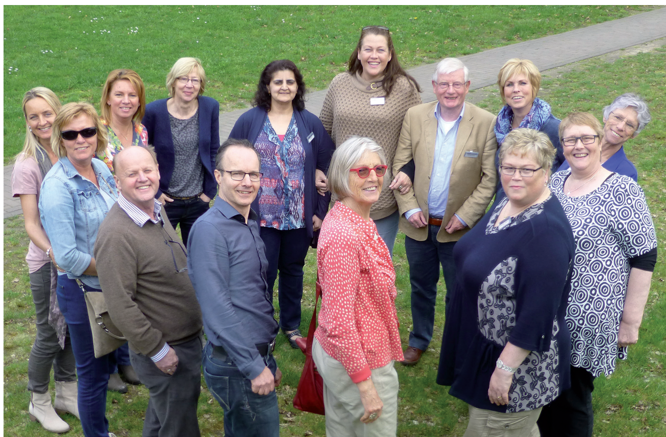
Nieuwe en aftredende bestuurs- leden met aantal deelnemers werkgroep DSDNederland