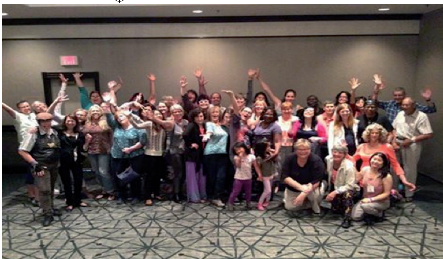
Foto: deel van de conferentie- gangers.